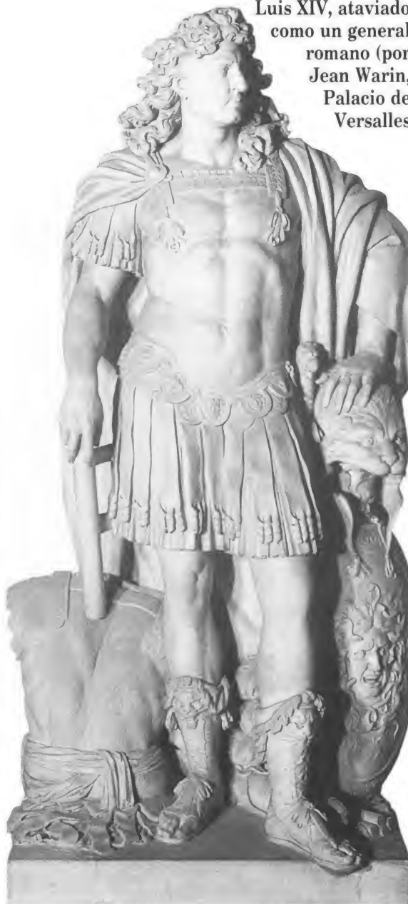
Luis XIV, ataviado como un general romano (por Jean Warin, Palacio de Versalles)

los Países Bajos españoles y al Franco Condado, al área renana y al Mediterráneo —victorias de Duquesne—. Pero la potencia de Luis XIV no era fácil de abatir y hubo que llegar a acuerdos después de casi siete años de guerra interminable. Tres tratados sucesivos entre Francia, por una parte, las Provincias Unidas, España y el Emperador, por otra, restablecieron la paz. Los holandeses recuperaron íntegro su territorio e incluso obtuvieron la abolición de las tarifas aduaneras establecidas contra ellos por Colbert. España, en cambio, pagó la guerra perdiendo el Franco Condado y doce nuevas plazas fuertes en los Países Bajos, canjeadas por otras anteriormente entregadas. Gracias a ello, la frontera francesa del Norte se haría